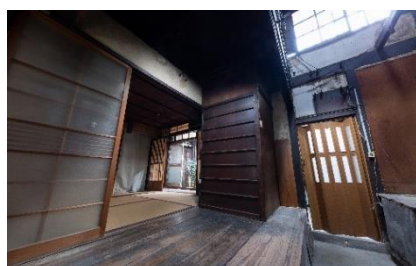
リノベーション前

時代の流れに沿った整備を行い、人の流れを生むことで街は街として息づきます。わたしたちは受け継がれてきた歴史や文化を次の世代に紡ぐ担い手になりたいと考えています。