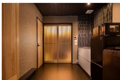
つむぎ かわらまちにじょう 8/17 オープン「紡 河原町二条」