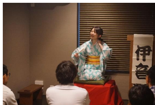
一服の笑いで繋がる

ご参加いただいた近隣住民の方からは「夏らしい演目で楽しめた」 「工事中からどんな出来上がりになるのか興味を持っていた。町家 らしい雰囲気うまく作ってあり驚いた」などの感想をいただきました。