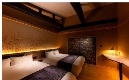
丈夫な梁は残して活かす施設作り