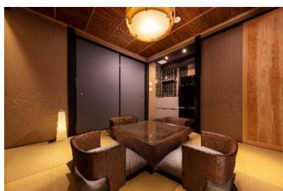
つむぎ しちじょうほりかわ 9/14 オープン「紡 七条堀川」