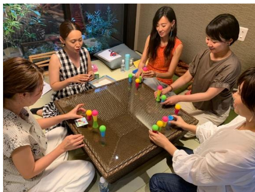
アナログゲームの講座風景

地域交流の一環として、「紡 七条堀川」「紡 河原町二条」において下記のとおりイベントを開催しました。