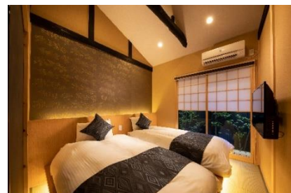
つむぎ きょうとえきみなみ 9/22 オープン「紡 京都駅南」