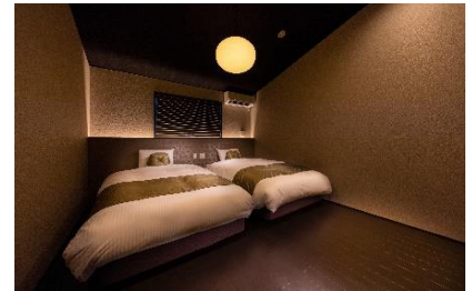
高い天井と柔らかいフォルムを持つ間接照明で癒しのひとときを

施設名 : 紡 河原町二条 (つむぎ かわらまちにじょう) オープン日 : 2019年8月17日 住所 : 京都市中京区橋柳町 152-2 アクセス : 京都市営地下鉄東西線「京都市役所前」駅徒歩5分 京阪電車「三条」駅徒歩約10分 京都市営地下鉄烏丸線「烏丸御池」駅徒歩約10分 周辺情報 : 京都御所 徒歩約10分 施設概要 : 延床面積 59㎡ キッチン、冷蔵庫、調理器具、食器、電子レンジ、 掃除機、洗濯機、お風呂、トイレ、Wi-Fi 完備 (無料) 定員 : 最大5名 料金 : 1泊3万円前後を予定 特徴 : 施設から徒歩圏内の御池通周辺は、飲食施設やコンビニ、スーパーなども多く滞 在の際に大変便利。新京極商店街や三条商店街などのお土産が買えるポイントも徒歩 圏内。