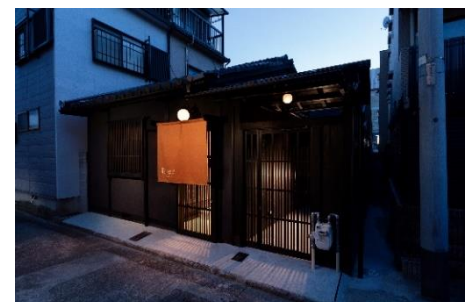
平屋造りの趣ある外観

施設名 : 紡 京都駅南 (つむぎ きょうとえきみなみ) オープン日 : 2019年9月22日 住所 : 京都市南区東九条室町 30-37 アクセス : JR「京都」駅徒歩5分 京都市営地下鉄烏丸線「京都」駅徒歩7分 近鉄京都線「東寺」駅徒歩6分 周辺情報 : 清水寺 市バス利用で約30分 東寺 徒歩約15分 西本願寺 徒歩約15分 東福寺 JR奈良線利用で約20分 施設概要 : キッチン、冷蔵庫、調理器具、食器、電子レンジ、 掃除機、洗濯機、お風呂、トイレ、 Wi-Fi 完備 (無料) 定員 : 最大2名 料金 : 1泊2万5千円前後を予定 特徴 : 施設周辺にはイオンモール京都をはじめ、コンビニやコインランドリーなどが近くに ございます。また、京都駅周辺には飲食施設が充実しており快適な滞在が可能です。