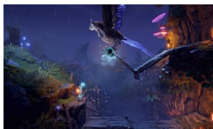
▲アマデウスは母鳥と共に足場を確保

キャラクターの切り替えがカギとなります。アマデウスでは、足場となるボックスを召喚し物体を操作。ポンティアスでは、大ジャンプや盾を構えて光を反射させるギミックや戦闘、ゾヤではロープを結び足場の確保や弓矢を駆使したアクションが楽しめます。