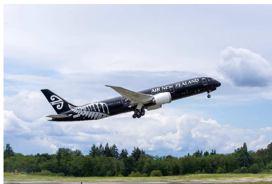
▲選手を乗せるニュージーランド航空 39 便