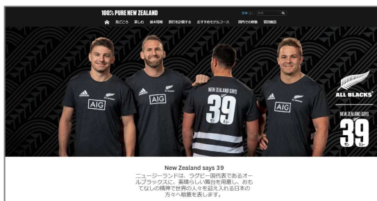
▲「New Zealand Says 39」特設ウェブサイト