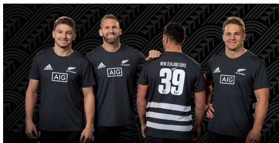
▲「New Zealand Says 39」ロゴ入りTシャツ

SNS 上では、“オールブラックス”の限定グッズなど、豪華なプレゼントが当たる Twitter フォロワー&リツイートキャンペーン第1弾「ニュージーランドから日本のみなさん！ありがとうキャンペーン」が本日よりスタートし、大会終了後には第2弾も実施予定です。加えて、9月22日（日）の「ニュージーランド サンキューフェス」開催時にはSNS（Twitter）を通じてのライブストリーミング配信の展開も予定しています。