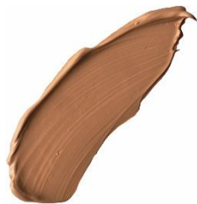
HCF-3 ベージュオークル