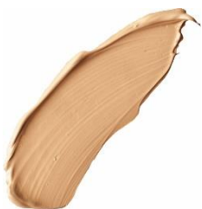
HCF-2 ナチュラルベージュ