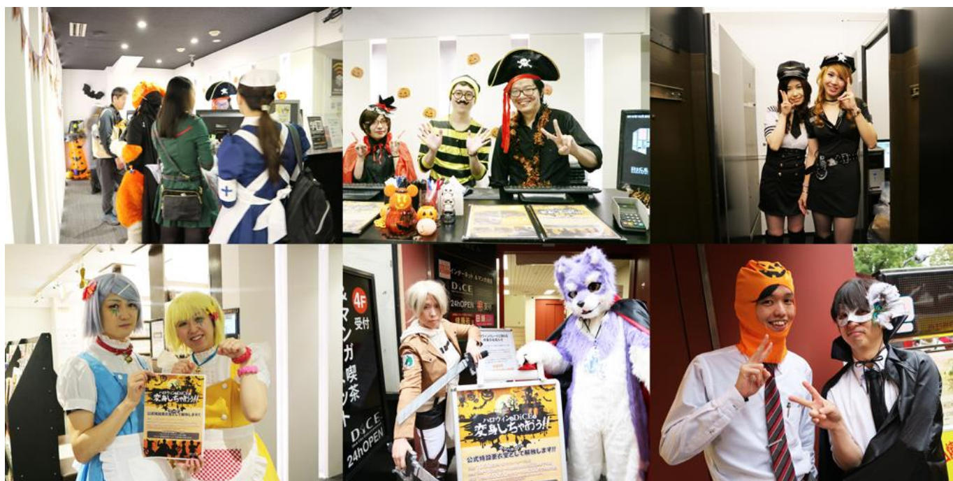
（画像：カワサキ ハロウィン 2017・2018の様子）

株式会社シティコミュニケーションズ（本社：神奈川県横浜市 / 代表取締役社長：三田 大明）が運営するインターネットカフェ「DiCE（ダイス）川崎チネチッタ通店」では、2019年10月27日（日）川崎駅周辺にて開催される「第23回 カワサキ ハロウィン 2019（通称：カワハロ）」にて、通常インターネットカフェとして営業している区画を「カワサキ ハロウィン」に参加する一般仮装者を対象に、更衣スペースやクロークとして開放いたします。全3フロアのうち、4Fは受付＆クロークエリア 5F/6Fは更衣室エリアとなります。また、ドリンク・コミック・ソフトクリーム等のコンテンツも通常通り提供いたします。