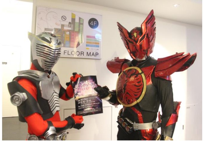
画像は「カワサキ ハロウィン 2018」の様子（左：銀龍商店街、右：DiCE 川崎チネチッタ店内の利用客）