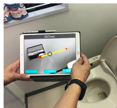
見積アプリ『FUS II』による手すりの設置