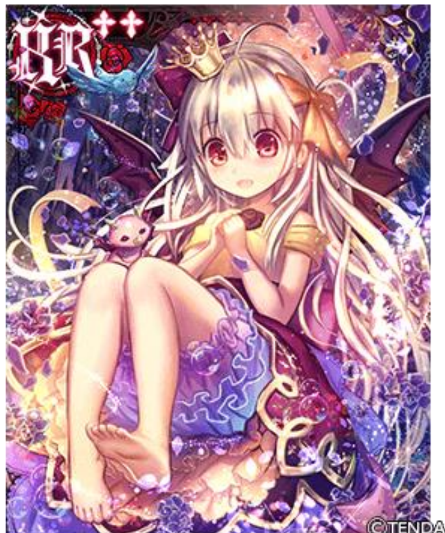
ヴァンパイア覚醒時