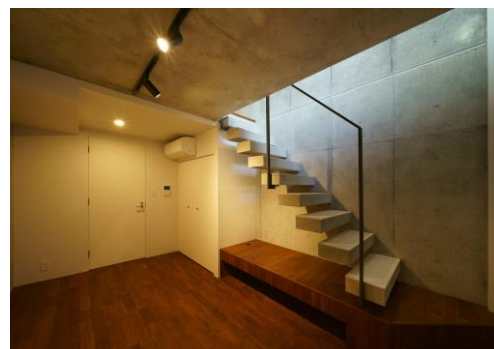
デザイン性の高い室内