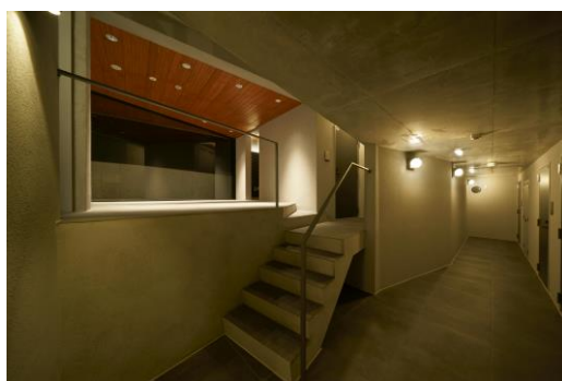
敷地の既存の高低差を活かしたスキップフロア