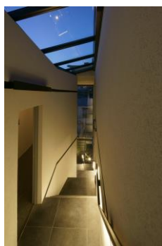
空を切り取る大きな天窗