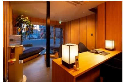
ゲストをお迎えする専用レセプション