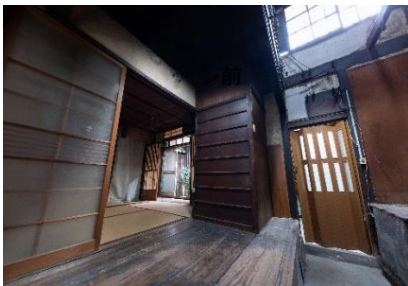
町家の趣は残して改装を行う

当社は多くの歴史的文化的価値を持つ「京町家」を次の世代に受け継ぐべきものであると考え、外観や内観の趣や意匠をできるだけ残し、一日一組限定の一棟貸し宿泊施設として再生する取り組みを行っております。デザインや施工、運営管理、清掃まで一貫してトータルサポート出来ることが当社の強みであり、宿泊していただくゲストには京町家に泊まるという特別な体験を、そして地域社会には街の再生や活性化という形で貢献していきたいと考えています。時代の流れに沿った整備を行い、人の流れを生むことで街は街として息づきます。わたしたちは受け継がれてきた歴史や文化を次の世代に紡ぐ担い手になりたいと考えています。