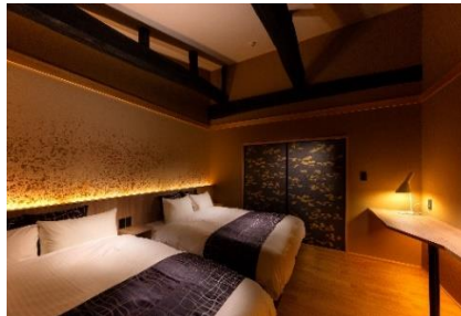
丈夫な梁は残して活かす施設作り