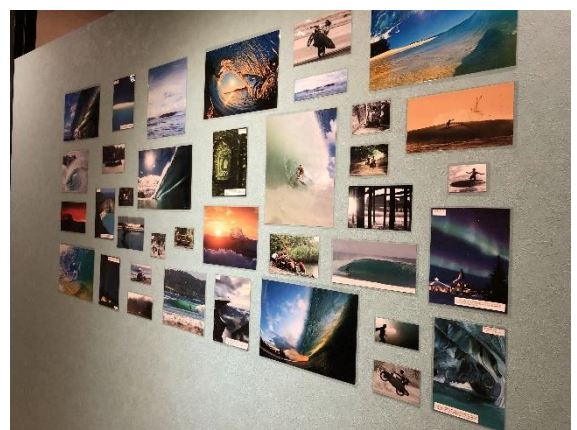
世界の海がみえるギャラリースペース