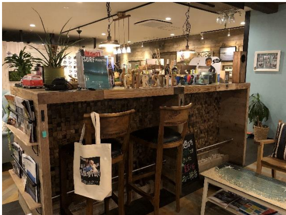
ロビーにある特注バーカウンター