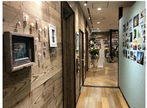
木の温もりを感じるホール