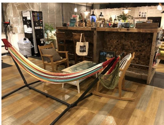
休憩スペースにあるハンモック