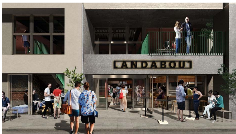
▲正面入口イメージ

「LANDABOUT」は、国内外を問わず多様な人々が東京の拠点として利用する、身近で新しい出会いに満ちた場となります。単なるホテルプロジェクトにとどまらず、“まちの見方を変える「エリアリノベーション」の旗印”となることを目指します。