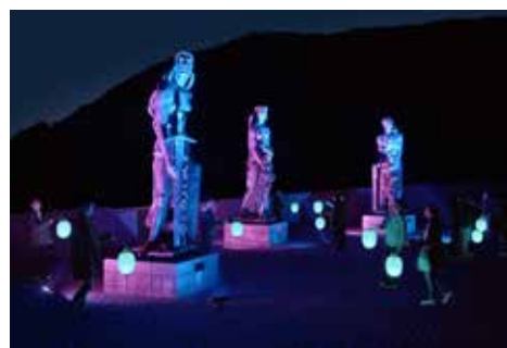
《Glow with Night Garden Project in Hakone》 箱根ナイトミュージアム, 2017, 彫刻の森美術館, 神奈川