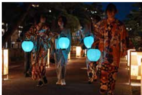
《Glow with City Project in Ashikaga》 足利灯り物語, 2019, 足利まちなか遊学館 / 利性院 / 旧東映プラザ / 鑑阿寺 / 足利尊氏公像 / 史跡足利学校, 栃木

Glow with City Project Glow with Night Garden Project