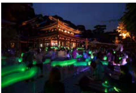
《Glow with City Project in Kamakura》 長谷の灯かり, 2015, 長谷寺, 鎌倉