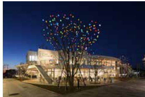
《ひかりの実》 アートプロジェクト, 2017, 太田市美術館・図書館, 太田