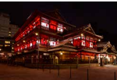
《道後温泉本館ライトアップ 大遷暦のお色直し》 道後オンセナート 2014, 道後温泉本館, 松山