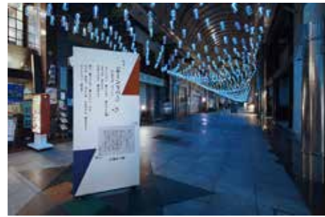
《ムーンリバー》 第 33 回国民文化祭・おおいた 2018 / 第 18 回全国障 害者芸術・文化祭おおいだ大会, 中津水灯り 2018, 日ノ出町商店街, 大分