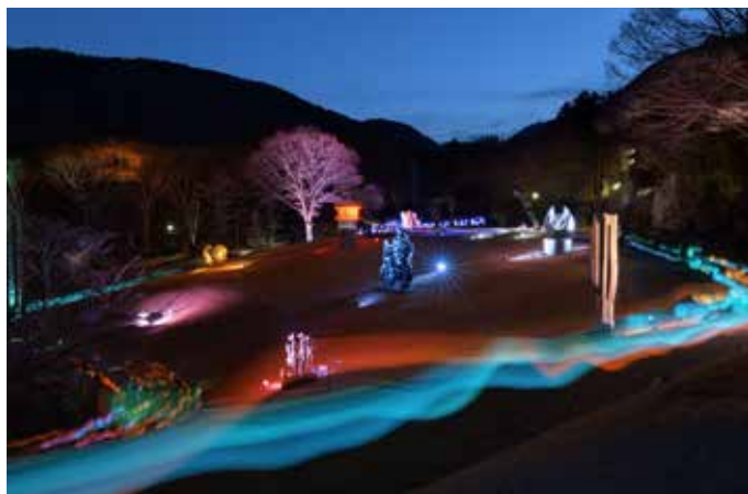
高橋匡太 《Glow with Night Garden Project in Hakone》