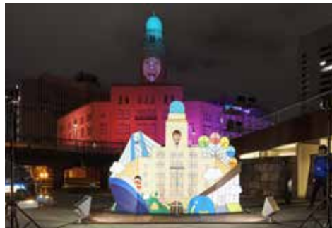
《カオハメ・ザ・ワールド》 スマートイルミネーション横浜 2017, 象の鼻パーク, 横浜