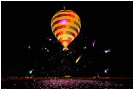
《夢のたね 2018 Yamaguchi》 第 35 回全国都市緑化やまぐちフェア 山口ゆめ花博, 山口きらら博記念公園 海の大海原ゾーン, 山口