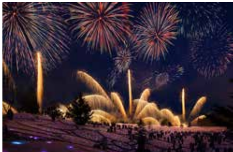
《Gift for Frozen Village 2018》 越後妻有 雪花火 2018, あてま高原リゾート ベルナティオ, 十日町