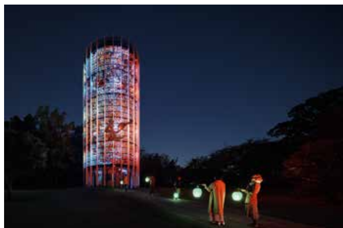
高橋匡太 《Glow with Night Garden Project in Hakone》 ガブリエル・ロアール 《幸せをよぶシンフォニー彫刻》