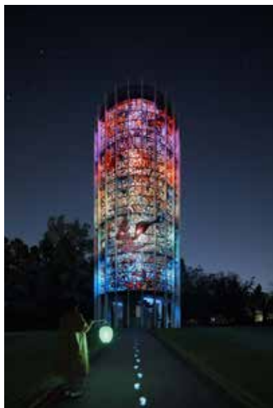
高橋匡太 《Glow with Night Garden Project in Hakone》 ガブリエル・ロアール 《幸せをよぶシンフォニー彫刻》