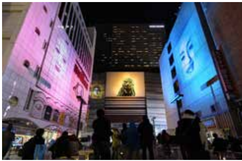
《たてもののおしばい》 たてもののおしばい 歌舞伎町の聖夜, 2018, 歌舞伎町シネシティ広場, 東京