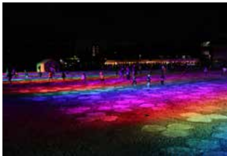
《ひかりのクローバー》 ひかりの広場, 2018, 東九条・北河原市営住宅跡地, 京都