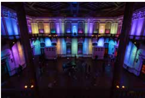
《いつかみる夢》 京都府美術工芸新鋭展 2013 京都美術ビエンナーレ, 京都文化博物館, 京都