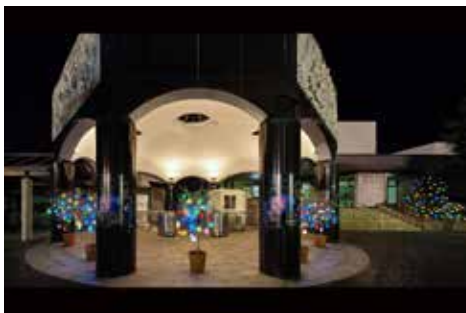
《ひかりの実》 箱根ナイトミュージアム きょうたさんと《ひかりの実》 をつくらう!, 2018, 彫刻の森美術館, 神奈川