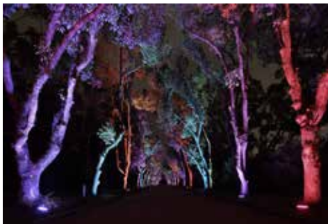
《くすのぎ並木ライトアップ》 観覧温室夜間開室とイルミネーション 2017, 京都府立植物園, 京都