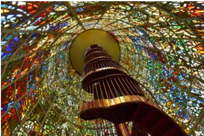
日中の内観 ※ライトアップ時間は踊り場まで入場可