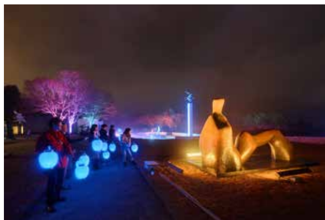
高橋匡太 《Glow with Night Garden Project in Hakone》