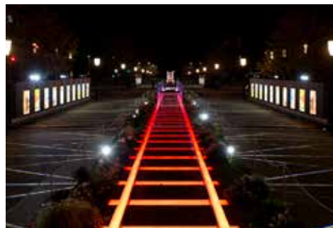
《光のレールウェイ》 東京ミテラス 2013, 東京駅前 行幸通り, 東京