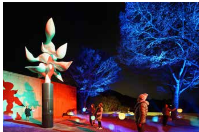
高橋匡太 《Glow with Night Garden Project in Hakone》 岡本太郎 《樹人》