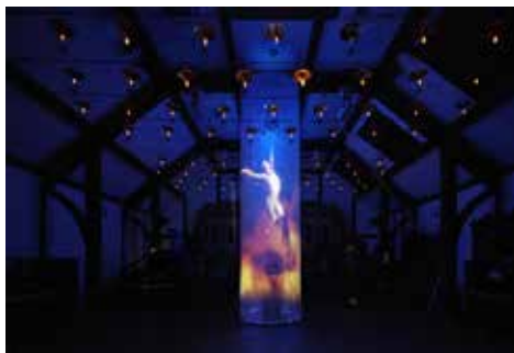
《ミシュレの『魔女』より》 六甲ミーツ・アート 芸術散歩 2017, 六甲オルゴール ミュージアム, 神戸