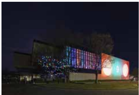
《10 Days Older, Meeting Shadow Play》 クロージングイベント 富山県立近代美術館ライトアッ プ, 2016, 富山県立近代美術館, 富山