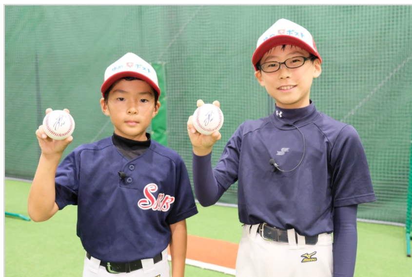
(写真左：里崎さんのサインボールを手に。こうすけくん（左）と、しんたろうくん（右）)

2人のキャッチボールやバッティングを見て、丁寧にアドバイスをしてくれる里崎さん。憧れの里崎さんを前に、最初は緊張していた2人も、里崎さんからの「いいね！」と褒められて、嬉しそうでした。