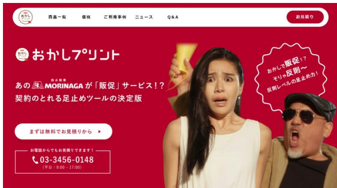
＜おかしプリントサイトの TOP ページ＞

森永製菓株式会社(東京都港区芝、代表取締役社長・太田 栄二郎)は、2019 年 11 月より、法人向けノベルティお菓子サービス「おかしプリント」のサービスを拡充し、サービス対象商品に「ダース」や「おとっと」等の人気商品を追加し、全 10 品体制でより魅力的な販促サービスへとリニューアルいたします。