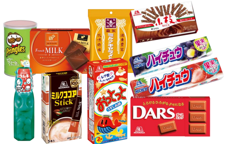
＜おかしプリントで使用可能な商品ブランド＞

「おかしプリント」は小ロット(50 個)から、オリジナルパッケージのお菓子を作ることができる、法人向けノベルティサービスです。最短 1 週間という短納期と、簡単に会社のロゴやオリジナルの画像を、お客様になじみ深い「ハイチュウ」等のパッケージにデザインできるため、他のノベルティツールよりも「足止め」効果が高く契約に繋がるという点でご好評を頂き、2016 年 1 月のサービス開始以降 1,300 社を超える企業にご採用頂いております。