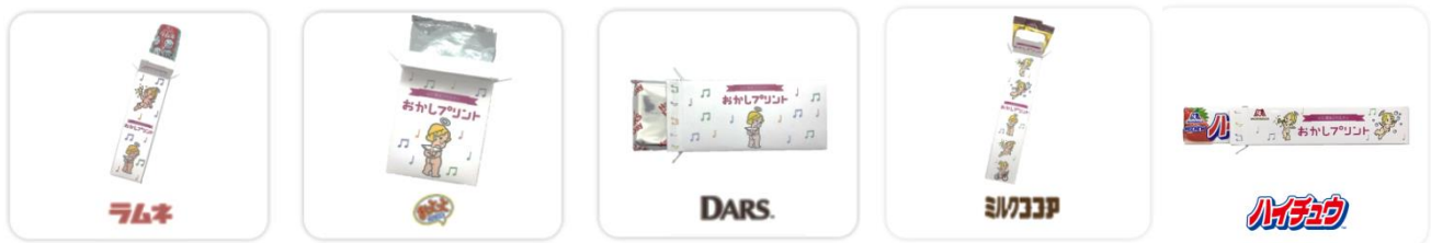
＜新しく追加した 5 品＞

この度、「ハイチュウ」、「カレド・ショコラ」、「小枝」、「ミルクキャラメル」、「プリングルズ」に加えて、「ダース」「おとっと」「ラムネ」「ミルクココア」の 9 ブランドがご利用いただけることになりました。また、サービス開始当初から一番人気アイテムの「ハイチュウ」にストロベリー味が加わり、全 10 品体制へと大幅拡充いたします。