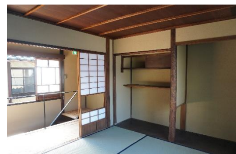
民泊として運営予定の一部屋