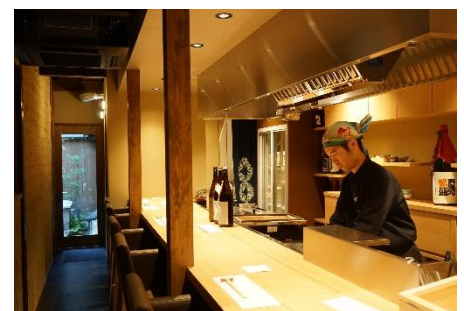
町家の作りを活かしたカウンター