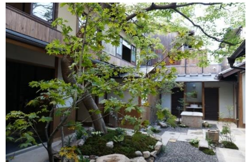
樹齢 100 年を超えるもみじ

元々松原通に面した表 3 連棟、裏 2 連棟からなる計 5 軒の町家（敷地面積約 300 m 2 ）が集まり口の形を作っていました。敷地内の中庭には樹齢 100 年を超えるもみじが植わっていますが、長らく空き家となっていたため、改修前は傷みが激しい上に動物が住み着くなど近隣への問題も抱えていました。2018 年の台風 21 号の影響で更に傷みが激しくなり、トタン屋根や瓦が飛散したことがきっかけとなり今回の改修を決断するに至りました。京町家の改修は技術や構法の観点からとても難しいうえに費用が高額となるため、「取り壊す方がよっぽど簡単」だったと駒井さんは言います。今回、京町家の保存再生に向けて活動を行う「京町家再生研究会」が主導となり、改修工事は「京町家作事組」と呼ばれる伝統構法の技術を継承する活動を行う職人集団が行うことで、このプロジェクトは実現することが出来ました。