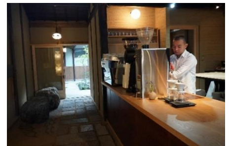
建具や灯りにもこだわった店内