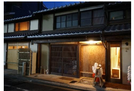
松原通に面した施設外玄関帳場入口