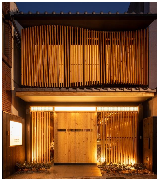
モダンながら京都の街並みに沿う外観

今回開設する当社の東寺店は、住宅事業の強化と今後簡易宿所を運営する際に必要となってくる「施設外玄関帳場」（注1）を兼ねています。1Fに施設外玄関帳場とオフィスを配置し、2Fは宿泊施設として運営予定で、12月の開業を目指しています。