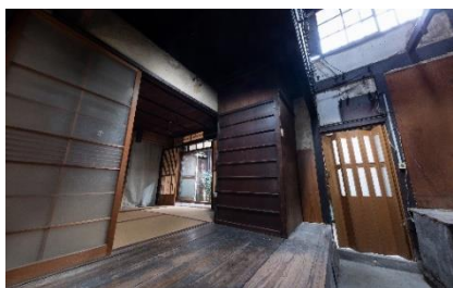
リノベーション前

時代の流れに沿った整備を行い、人の流れを生むことで街は街として息づきます。わたしたちは受け継がれてきた歴史や文化を次の世代に紡ぐ担い手になりたいと考えています。