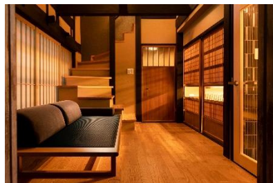
丈夫な梁や柱は残して活かす施設作り