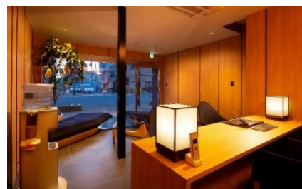
京都駅前の専用レセプション