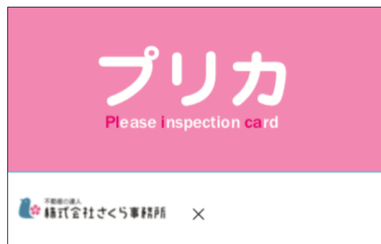
プリカ（見本・表面）

そこで、株式会社さくら事務所は、それらの問題点の突破口として、 2019年11月18日（月）より中古物件の買主の方と仲介会社様とのコミュニケーションを円滑にするカード「プリーズ・インスペクション・カード」略して『プリカ』を発行・配布すること を発表します。HIを利用したい買主の方は、不動産仲介会社様に『プリカ』を提示するだけ。提示された仲介会社様は、裏面にあるQRコードを読み込めば、さくら事務所のWEBサイト内にある手続き方法に従って準備していただくものがわかります。また不動産仲介会社様に『プリカ』を快く受け取っていただくことで、買主の方との間にある「信頼感」をさらに上げる一助になることも目指しています。買主の方には「いい家」を、仲介会社様には「信頼」を得ていただくために、ぜひ『プリカ』をご活用ください。