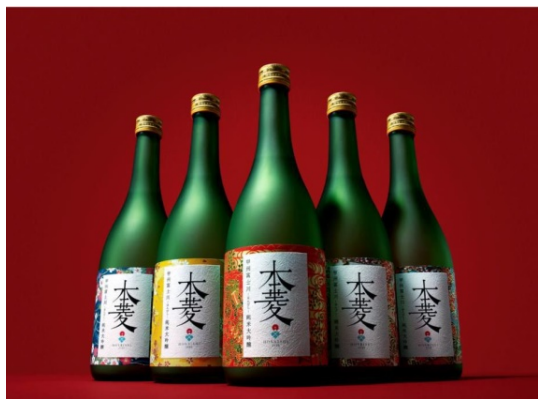
富士川町の新名産「甲州富士川・本菱・純米大吟醸」

地域資産を発掘し地元の人たちで名産品をゼロから作り上げる、まち育てプロジェクト「まちいく」を主催するむすび株式会社(本社:東京都目黒区、代表:深澤了)は、2019年11月15日(金)、第10回さわやか信用金庫物産展に出店いたします。