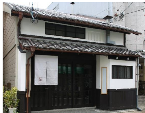
「紡 伏見稲荷」施設外玄関帳場

今回のイベントをメディアの皆様にご公開させていただきます。京都の町を、京都を支える陶芸作家とともに盛り上げる取り組みです。ご多用中とは存じますが、ぜひご取材いただけますようお願い申し上げます。