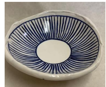
絵付け体験作品 イメージ図