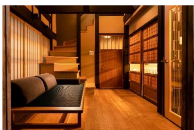
丈夫な梁や柱は残して活かす施設作り