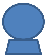
22歳・女性 アルバイト就業

就活カルテの自己診断をしたときは、できてない項目が多く少し凹みましたが、同時に今後必要な対策が見えてすっきりしました！私は、面接経験が足りないことから、自己理解とプレゼンテーション力に自信がないと気づけたので、研修の中で、人前で話すことに積極的にチャレンジしたり、面接対策に力を入れることができました。日々自分の成長を実感できるのが嬉しくて、集団面接会にも自信をもって望むことができました！