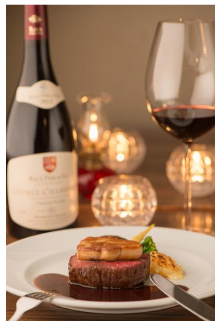
左画像：愛犬とフレンチを楽しむ様子 右画像：国産 A5 黒毛和牛とフォアグラのロッシーニ風 赤ワインソース