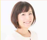
一般社団法人ANDMAMACO 代表理事

女性の働くを応援!結婚、出産、子育て、介護を大切にしながら自分らしく働くANDMAMACO代表