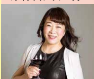
野口店舗開発株式会社 代表取締役