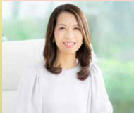
EVOL株式会社 代表取締役CEO