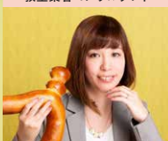
一般社団法人日本レジュアワー協会 代表理事