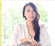
株式会社ホワイツワリー 代表取締役社長

営業なしでも必ず売れる! サステイナブルブランド海外起業家 / クリエイティブディレクター