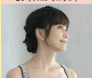
株式会社ORYZAE 代表取締役

顧客は医療従事者から実業家、スピ系まで!アロマで夢を叶えるビジネスコンサルタント