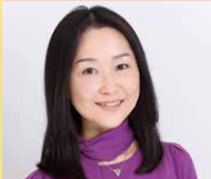
株式会社トータルフード 代表取締役

「世界一受けたい授業」出演! テーブルマナーから売れる飲食店づくりまで! 食のスペシャリスト