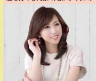
有限会社 九曜 Office BBL 取締役

「服装力×振る舞い力×プレゼン力」で売り上げアップ! 魅せ方の専門家「印象スタイリスト」