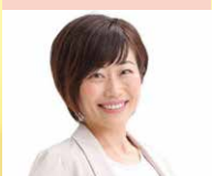
NPO法人ちえぶら 代表理事