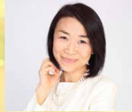
株式会社ブリッジインターナショナル創業CEO

世界一の通訳で培ったノウハウであなたの英語力も人生も成功も10Xに! 純国産トップ通訳 / 社会起業家