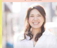
一般社団法人ブリッジ・フォー・マザーズ 代表理事