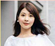
株式会社Loveable 代表取締役

ベンチャー企業の理想的な組織づくりをしっかりとサポート! "愛すべき"経営企画室