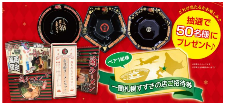
賞品画像(一部抜粋)