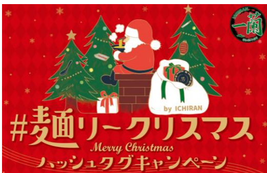
キャンペーン画像