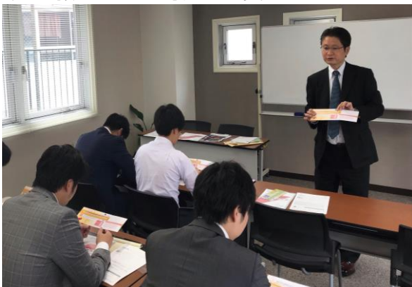
スキルアップ研修の様子

当社は平均年齢 28 歳で、20 代～30 代と比較的若い年齢の社員が多く在籍しています。国内の高額商品を取り扱う業務を行っているため、お客様に最高のサービスをお届けする者として、日頃から身だしなみや接遇などをはじめとするビジネスマナー研修、スキルアップ研修等を社員におこなっています。