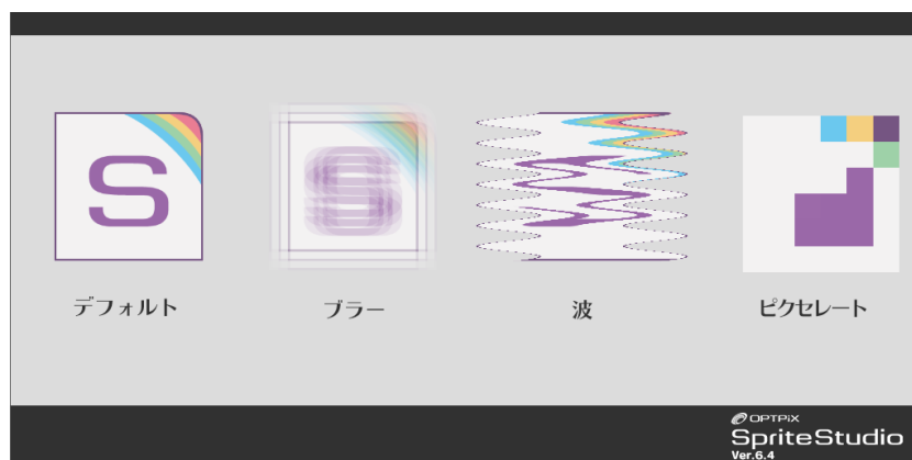
カスタムシェーダーを使用したアニメーションの例

シェーダーファイルのサンプルは後日 OPTiX ヘルプセンターで公開予定です。ダウンロードしたシェーダーファイルをそのまま利用するだけでなく、アレンジして利用することもできます。