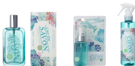
左より オードトワレ / パフュームジェリー / ファブリックスプレー