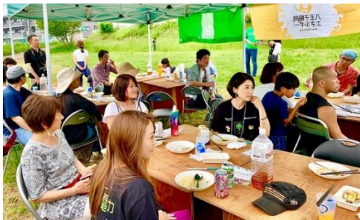
磯沼ファーム見学とバーベキュー 東京都八王子市 2019年6月2日(日)

電力の生産地を訪れ、そこに携わる人々との交流を通して、電気の大切さやその土地ならではの食、観光資源などを理解いただく機会となります。