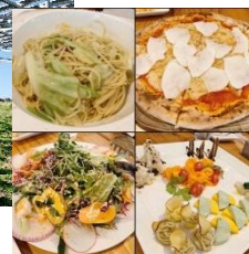
ソーラーシェアリングと農園見学 千葉県匝瑳市 2019年11月30日(日)