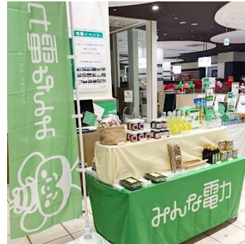
「電気と食の物産展～下北半島編～」 マルイファミリー満口 2019年9月19日(木)～9月25日(水)

「顔の見える電力」をご利用いただいている法人、個人のお客様同士が繋がることで、企業のサステナビリティへの取り組みや“顔の見える”品物に触れる機会を提供してまいります。