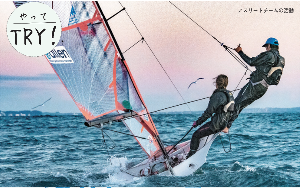
アスリートチームの活動