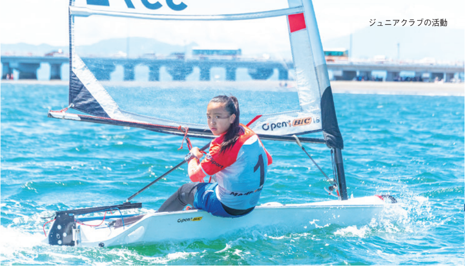
ジュニアクラブの活動

地元江の島で開催される、東京 2020 大会の種目セーリング競技。 江の島の目の前にある総合型地域スポーツクラブ「江の島ちょっとヨットビーチクラブ」では、2020 年 4 月からの新入会員を募集しています。