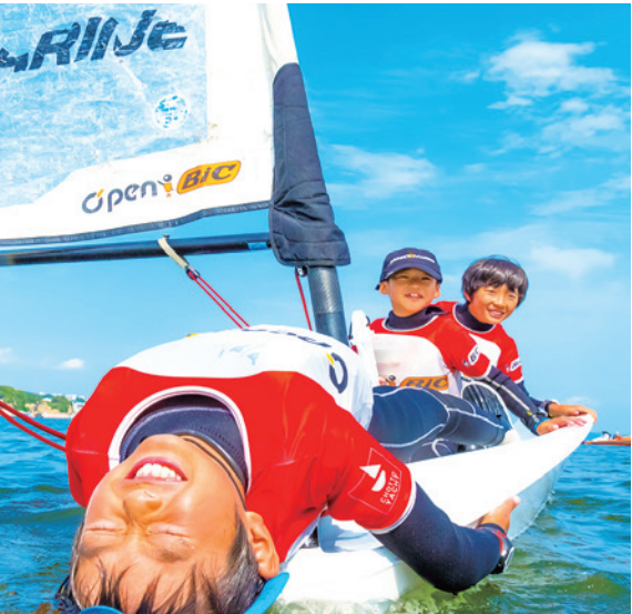
下右 ジュニアクラブの活動 キッズスクールの活動

会費は月に何度でも活動できる定額制 世界を目指す「アスリートチーム」も新設 「海のある湘南に住んでいるんだから、子どもにもマリンスポーツを習わせたい」という保護者も多いのでは？ 「ちょっとヨットビーチクラブ」では、東京 2020 大会の正式種目であるセーリングやサーフィンのほか、SUP などを中心に多彩なマリンスポーツを通じて、スポーツの本当の面白さを体感しながら、体力的にも精神的にも成長できるカリキュラムを実施しています。 例えば、4 歳からの砂浜幼児教室（キッズ）は、水に慣れることから始め、海ヨット、カヤックと体験していきます。ライフジャケットを着用して参加するので、泳げない、水が怖い子どもでも、徐々に海に慣れしていきます。「ジュニアクラブでは一日を通しての活動は土・日曜が中心で、長期の休みは毎日でも活動できます。親から離れて活動することで子どもの自立を実感できました」と保護者にも好評です。キッズ会員は月額 3600 円、ジュニア会員は月額 7400 円。月に何回でも活動できます。また新年度から「アスリートチーム」を新設。「部活動に代わる活動で、2 人乗りヨットで活動する選手を募集します。セーリングの経験はなくても大丈夫です。セーリングで世界を目指すぞう」を目標に掲げ、経験豊富なスキッパーと共に活動していきます。