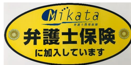
【自動車専用の弁護士保険ステッカー】