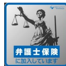
右【弁護士保険ステッカー】