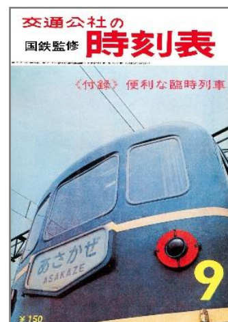
↑表紙カバーを外すと