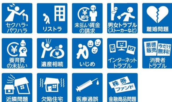
一般事件の法的トラブル一例