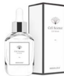
サロン専売 原液美容液

科学的に紫外線対策効果が認められた「ブライトニングパイン®」を 1 日の推奨摂取量を高配合。世界中から厳選した美容成分 38 種が体内の活性酸素の増加と炎症を抑制しつつ、肌にハリ・弾力・うるおいを与えます。