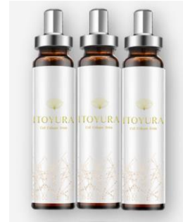
最先端の「飲む抗糖化ドリンク」

プレミアムハイクオリティーセラムは最新の美容成分を研究し確かな結果へ導く事にこだわって贅沢な有効成分を配合致しました。【脂肪増殖成分】+【美白・抗酸化成分】+【リフトアップ成分】の優れた3つの有効美容成分をベースにその他女性にうれしい美容成分をたっぷりと配合しました。そして毎日の使うものだからこそ、安心して使用していただけるお肌により優しい成分を配合。