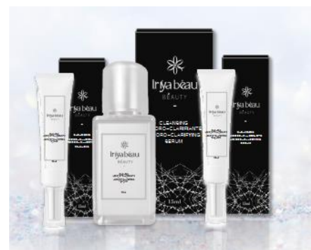
VIO.デリケートゾーン専用、美白セット

鳥取大学との共同研究で開発された特注生コラーゲンを99%原液で配合。さらに、京都大学との共同研究で開発された特注生超微粒子ナノプラチナと特注生超微粒子ナノゴールドを99%原液で配合しています。