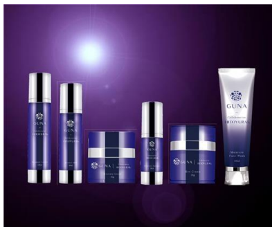
天然成分 × ヒト幹細胞コスメ 『GUNA×HITOYURAI+30』

1 日分で 1800kcal という驚きのカロリーカットと脂肪燃焼効果を実現!! 最先端の痩身医学に基づいたダイエット成分 200 種を濃縮配合!! 好きなだけ食べても痩せる新感覚ダイエットサプリです。