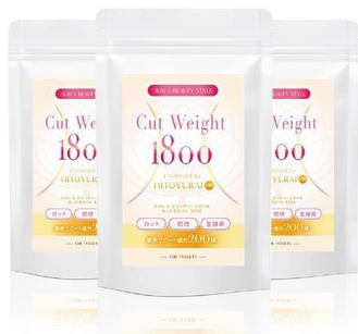
カロリーカットサプリ