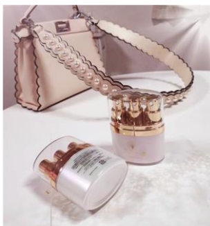
トラベルサイズ HITOYURAI トライアルセット

天然植物エキスを、潤いにこだわり、使用後の圧倒的なお肌の潤いを実現しました。また、幹細胞培養液エキスも 2 種類配合することで、肌の根本的な細胞力を高めるハイブリット化粧品です。