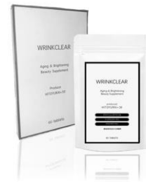
美白サプリ『WRINKCLEAR (リンクリア)』

HITOYURAI は肌の根本的な細胞力を高め、トラブルが起きにくいお肌を作ります。化粧水、乳液、クリームの 1 週間分が 1 セットになっているので、旅行や外泊の際にも幹細胞コスメでケアできる便利な 3 点セットが販売開始!