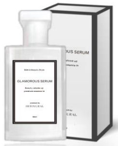
バストアップ美容液