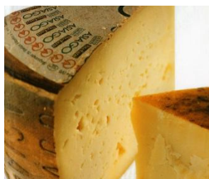
アジアーゴ (イタリア)