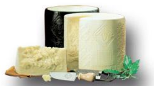
ペコリーノ ロマーノ (イタリア)