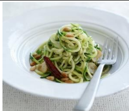
ズッキーニのペペロンチーノ

『スパイロゴー』は、ズッキーニや大根、ニンジン、長いも、ナスなどの野菜を麺状にカットすることができるベジヌードルカッターです。