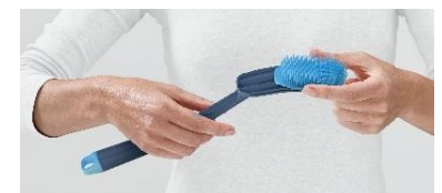
ブラシヘッドが取り外し可能