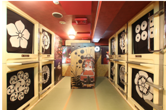
和をコンセプトにした「和カプ」（戦国カプセル）