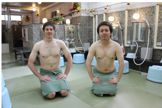
畳風呂と正座をする外国人

大浴場の床には防水加工された畳を使用。お風呂で畳を体験できることが外国人のお客様に好評です。また、ソフトで温かく滑りにくいことから高齢のお客様も安全にお風呂を満喫できます。