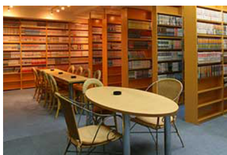
インターネット＆コミックコーナー