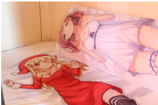
アニメコンセプトの「痛カプ」

当館には「忍」以外にも様々なコンセプトを持ったカプセルルームがあります。抱き枕やシーツなどアニメのキャラクターを全面に打ち出した「痛カプ」や、戦国武将・花魁をテーマにした「クールジャパンフロア」は外国人の宿泊客に人気です。（「忍」もクールジャパンフロアの一部です）