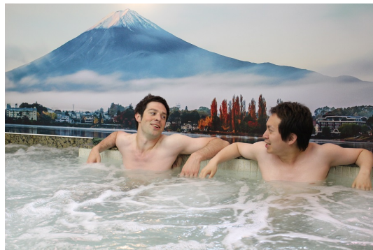
日本のお風呂といえば富士山の絵