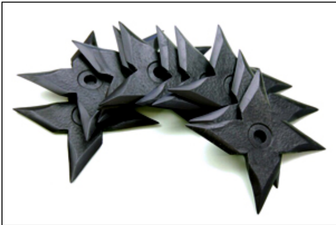
樹脂製手裏剣 「風車」

2月22日は忍者デーとして、ご来館いただいた先着 100 名様に樹脂製で作られた手裏剣をプレゼントいたします。