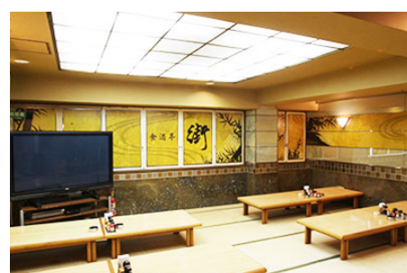
レストラン「食酒亭・街」