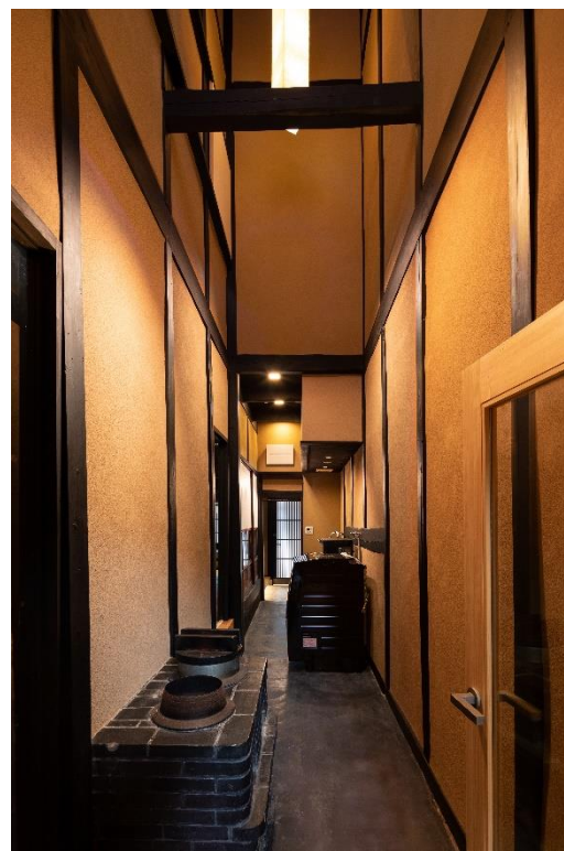
“トオリニワ”を活かしつつも快適さを追求した水廻り

施設名： 紡 八条源町（つむぎ はちじょうみなもとちょう） オープン日： 2020年2月15日 住所： 京都市南区八条源町 115 アクセス： 近鉄京都線「東寺」駅 徒歩約15分 各線「京都」駅 徒歩約20分 京都市バス16号系統「御土居」停留所徒歩約1分 施設概要： 延床面積 90.89 m 2 定員： 最大9名 料金： 一泊5万円前後を予定 特徴： 築83年の歴史を持つ京町家を改装した最大9名までお泊りいただける一棟貸しの宿泊施設です。築年数を重ねているものの比較的に良好な状態が保たれていた物件を約4カ月かけて改装し、正面から奥まで抜けるトオリニワや吹き抜け空間である火袋、おくどさんなど現況の趣を随所に残しつつ、ゆったりとお過ごしいただける空間に仕上げています。 京町家の一つの大きな特徴である「うなぎの寝床」と呼ばれる、間口は狭く奥に長い独特の形状を保っています。独立した3部屋の寝室を備えており、大人数でのご宿泊も快適にお過ごしいただけます。