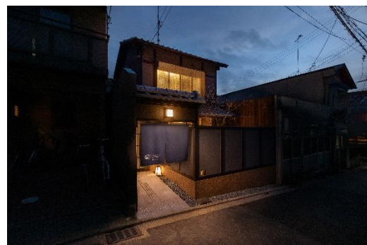
大通りから一筋入る閑静な立地環境

施設名： 紡 稲荷庵（つむぎ いなりあん） オープン日： 2020年2月15日 住所： 京都市伏見区深草上横縄町 17-13 アクセス： 京阪本線「伏見稲荷」駅より徒歩約4分 JR 奈良線「稲荷」駅より徒歩約8分 施設概要： 延床面積 60.70 m 2 定員： 最大5名 料金： 一泊3万円前後を予定 特徴： 国内外からの観光客で連日にぎわいをみせる伏見稲荷大社に程近い場所に位置し、観光に最適な立地です。大通りの喧騒を感じさせない、穏やかな時間の流れる路地奥の京町家となっています。 前庭と奥庭を配したことで双方から光と風が入り、移り変わる京都の四季を感じることができます。機能性、デザイン性に配慮した家具や備品でお客様の快適な滞在を実現します。古き良き趣を残し、歴史や文化に触れることができる空間へと改装いたしました。