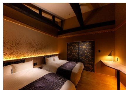
年代物の梁はあえて見せる工夫

社名 京阪電鉄不動産株式会社 代表者 代表取締役社長 道本 能久 所在地 大阪府中央区大手前 1-7-31 OMM15F 電話番号 06-6946-1341 事業内容 土地建物の売買、賃貸、仲介、管理 土木、建築工事の設計、施工、管理および請負業務 建設資材、設備機器、家具ならびに室内外装飾用品等の販売、斡旋 ホームページ https://www.keihan-kiss.co.jp