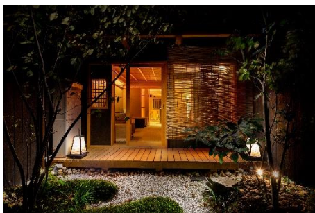
非日常な京町家ステイを体験できる