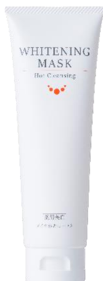
「[薬用美白] ル・ソイル ホットクレンジング ホワイトニングマスク」 (内容量：120g) 4,400 円（税込）4,000 円(税抜)

毛穴の「メラニンによる黒ずみ」に着目した新感覚の薬用クレンジングジェル。 温感作用で心地よくメイクをオフ!薬用美白成分「水溶性プラセンタエキス」が浸透し、シミ毛穴をケアします。ジェルがメイクや毛穴汚れにスルスルとなじみ、肌をこすることなく、クレンジングできます。ダブル洗顔も不要で、時短効果も抜群です! この薬用クレンジングジェルを継続してお使いいただくことで毛穴の黒ずみの原因であるメラニンの生成を抑制します。透明美肌を目指す方におすすめです。