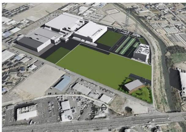
鴻巣研究所全体の鳥瞰図