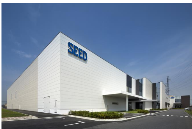
シード鴻巣研究所 2 号棟外観

シード鴻巣研究所は、1 日使い捨てコンタクトレンズ工場として、2007 年 7 月に埼玉県鴻巣市に竣工。2008 年 5 月から本稼働を開始し、2009 年 3 月に国産初となる 1 日使い捨てコンタクトレンズ「シード ワンデーピュア」を発売しました。この「シード ワンデーピュア」は、“瞳にやさしい UV カット” “汚れに強い両性イオン素材” “お得な 32 枚入り” など、国産ならではのきめ細かなものづくりによる付加価値に富んだレンズです。このレンズは 2011 年 12 月に、天然保湿成分をプラスしてうるおい感をアップさせた「シード ワンデーピュアうるおいプラス」へリニューアルしました。また、近視・遠視用に加えて、遠近両用や乱視用などの高機能・高付加価値を備えたレンズも取り揃え、日本国内のみならず、海外進出も積極展開しています。