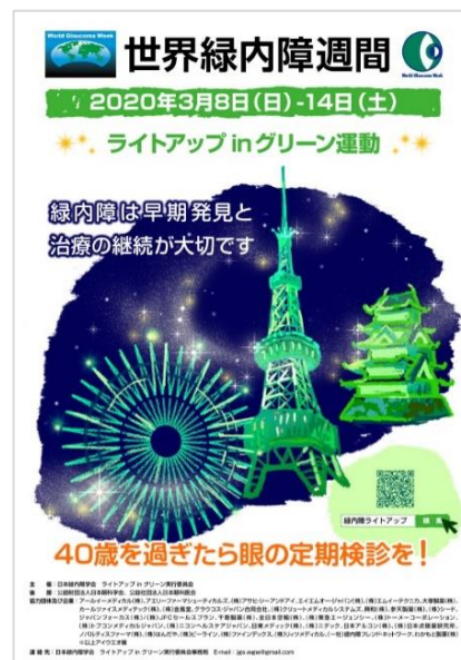
「ライトアップ in グリーン運動」ポスター

緑内障は、40 歳以上の 20 人に 1 人の割合で発症している※ 1 と言われており、我が国における中途失明原因の第一位となっております。一方で、近年の緑内障の診断技術や治療法の進歩により、早期に発見し治療を継続すれば緑内障により失明に至る可能性は大幅に減少するため、緑内障をよく知ること、自覚症状が無くても定期的に眼科を受診することが大切です。