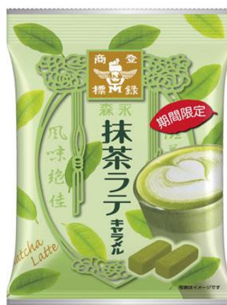
△抹茶ラテキャラメル