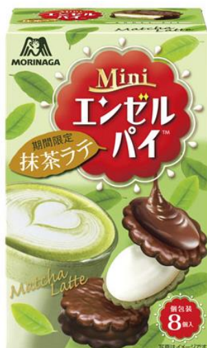
△ミニエンゼルパイ＜抹茶ラテ＞

春の風を先取りする期間限定の新商品で、ホッと一息ついて、お菓子タイムをお楽しみください。