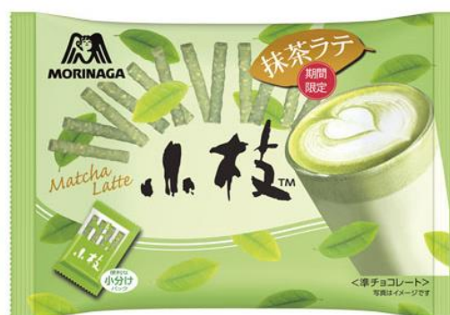
△小枝＜抹茶ラテ＞ティータイムパック