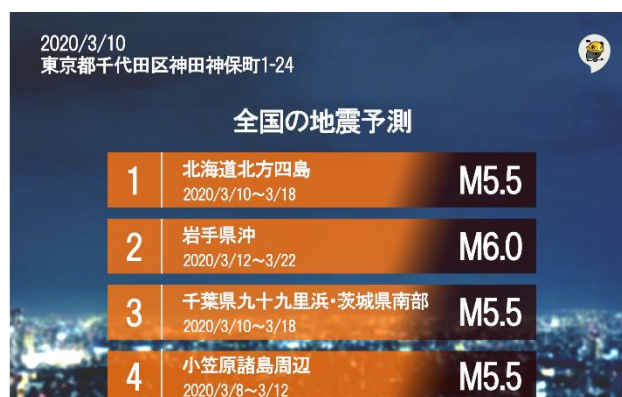
「地震予測」画面イメージ②