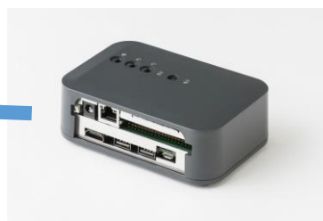
「IoT セキュア」を搭載した ビズライト社の IoT 装置

※ DOOH (Digital Out Of Home) の略 交通広告、屋外広告およびリテールショップ等に設置 されたデジタルサイネージを活用した広告媒体