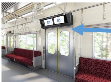
埼玉高速鉄道内車両内のデジタルサイネージ

当社は、ビズライト社と共同で、ビズライト社の提供するエッジボックスに IoT セキュアを OEM 提供します。