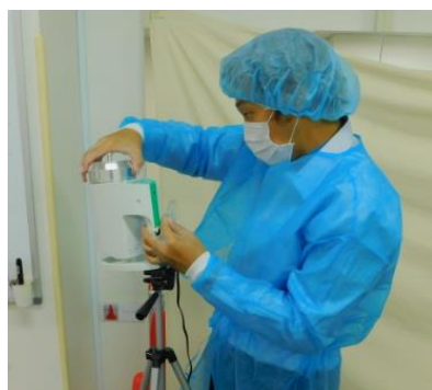
<浮遊菌検査を行う様子>