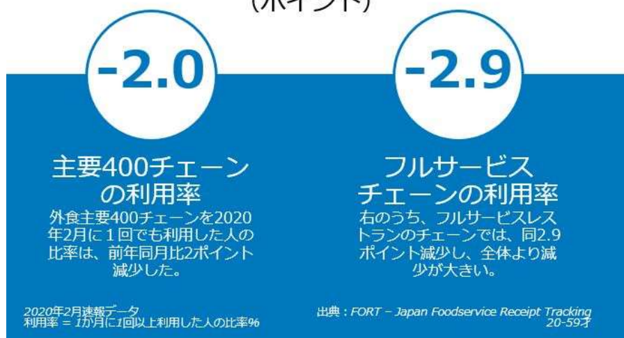
<図表2> 2020年2月の外食チェーン利用率の変化 (ポイント)

2020年1月後半に、中国で新型コロナウイルスの感染拡大が始まり、日本でも2月にはマスクが店頭からなくなるなど、影響が見え始めました。外食市場への大きな影響は、2月最終週から出始めていると考えられますが、2月計のデータから、すでに外食の客数が大きく減少し、中食へシフトしていることが分かりました。