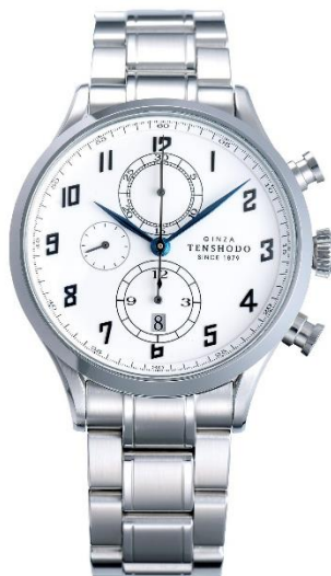
ステンレススチールブレス装着イメージ