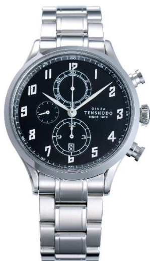
ステンレススチールブレス装着イメージ