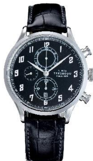
レザーストラップ（グレー）装着イメージ