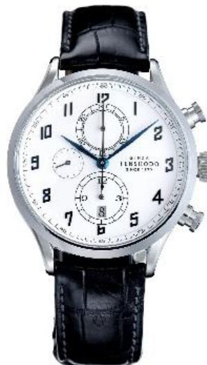
レザーストラップ（ネイビー）装着イメージ