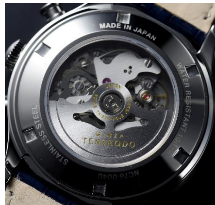
シースルーバックの裏蓋