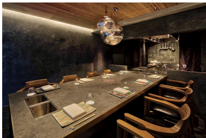
2020/3/20 グランドオープン「紡 Dining」