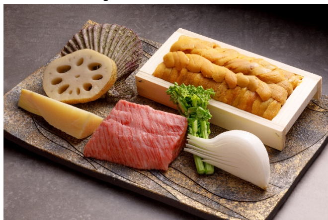
オープンキッチンを採用し特徴的なレイアウトの1Fダイニング A5ランクの「京都肉」をメインに、旬の素材を楽しむ