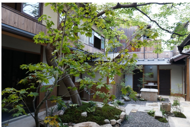
(施工後) 令和に甦り更に次の時代へ受け継ぐ