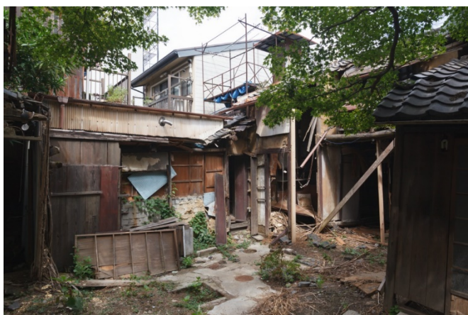
(施工前) 屋根が落ち危険な状態だった 築100年を越す5戸の京町家