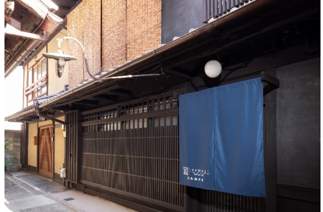
不動産特化型クラウドファンディングのプラットフォームを用いた「紡 松原御幸町」