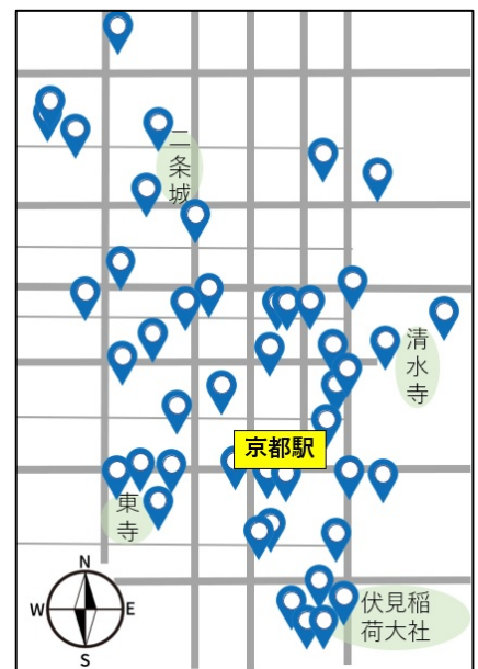
京都市内管理運営宿泊施設分布略図

京町家再生事業を加速させるため、2019 年度は京阪電鉄不動産株式会社と業務提携を行ない 2 棟の京町家を再生、また不動産に特化したクラウドファンディングのプラットフォームを利用し、個人に広く資金を調達する新しい試みに挑戦しました。