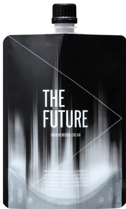
THE FUTURE 除毛クリーム 200g オープン価格

※1 自社アンケートより ※2 放置時間のこと。毛の質や量によって個人差があります。 ※3 一部店舗を除く