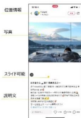
TikTok のプロモーション例

すでに箱根の旅館から依頼があり、今後は首都圏を中心に日本全国の100軒の宿泊事業者を6月末まで募集します。