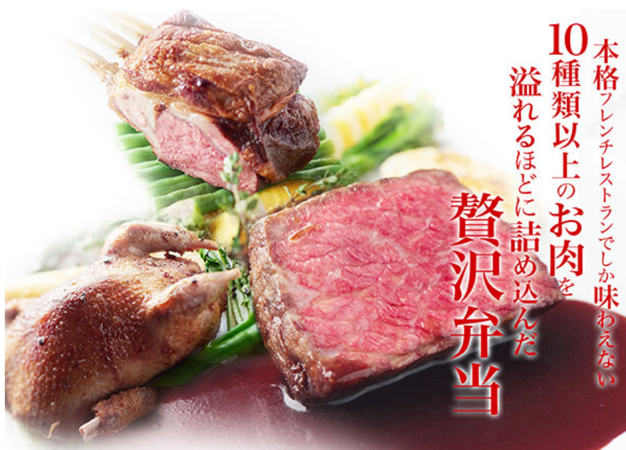
10種類以上の肉を使った 「Le FAVORI 特製贅沢肉弁当」

株式会社シティコミュニケーションズ（本社：横浜市神奈川区 代表取締役社長：三田 大明）が運営する高級フレンチレストラン「 ル ファヴォリ Le FAVORI」（所在：東京都千代田区紀尾井町 東京ガーデンテラス紀尾井町内 3F）が4月16日よりテイクアウトメニュー「Le FAVORI 特製贅沢肉弁当」（10,000円 税込）販売いたします。