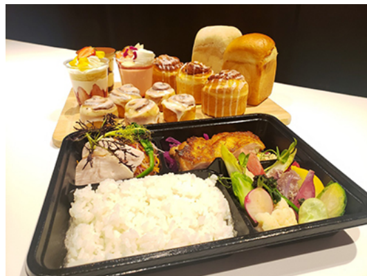
季節野菜たっぷりチキン弁当