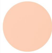
ナチュラルオークル