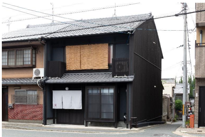
提供予定場所のひとつ「紡 伏見稲荷別邸」

(注 1) 施設外玄関帳場…京都では条例の改正に伴い、簡易宿所を営業する際には宿泊施設内または施設外に帳場（フロント）を設けることが必要になります。既存施設については 2020 年 3 月末まで経過措置がありますが、2020 年 4 月 1 日からは条例に基づいた運営が義務となるため、今後施設外玄関帳場の重要性はますます高いものとなります。