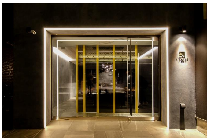
3/20 オープンした「紡 Dining」も休業を余儀なくさせられております。

当社は多くの文化的価値を持つ「京町家」を次の世代に受け継ぐべきものであると考え、外観や内観の趣や意匠をできるだけ残し、一日一組限定の一棟貸し宿泊施設として再生する取り組みを行っております。デザインや施工、運営管理、清掃まで一貫してトータルサポート出来ることが当社の強みであり、宿泊していただくゲストには京町家に泊まるという特別な体験を、そして地域社会には街の再生や活性化という形で貢献していきたいと考えています。