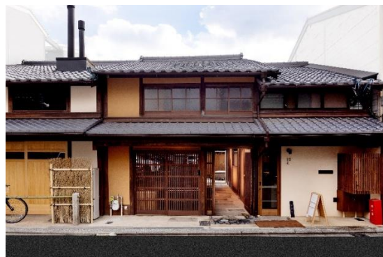
提供予定場所のひとつ「紡 松原御幸町もみじ邸」